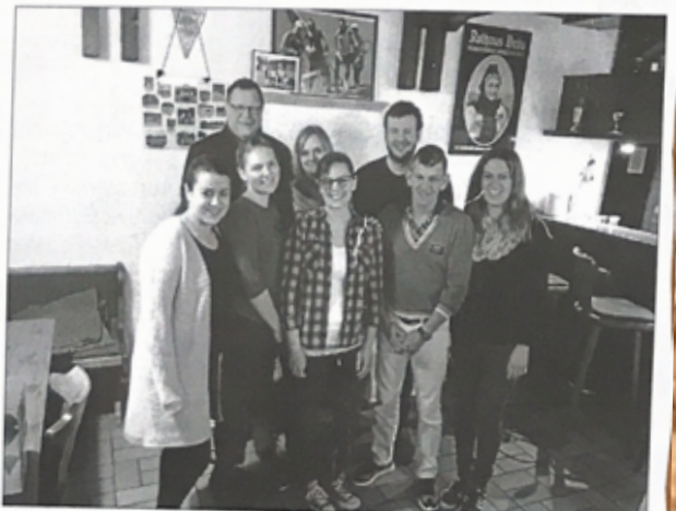
Ausschuss TC Heimerdingen